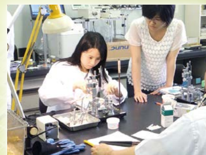
動物を用いた実験の様子