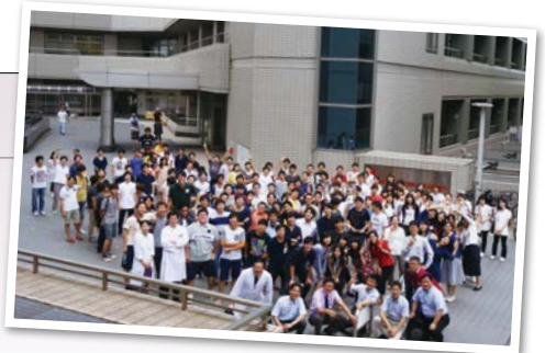
集合写真(先生と後輩と共に)