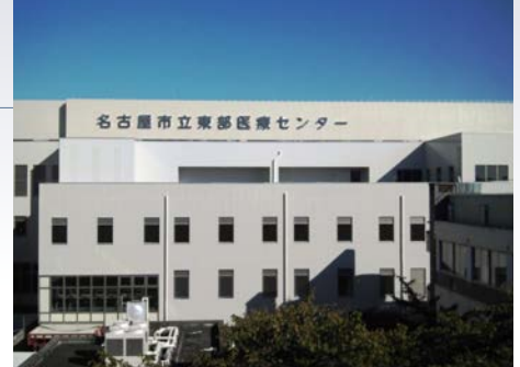
東部医療センター外観

このように、それぞれの病院の得意とする領域等を自由に組み合わせローテーションすることで、充実した臨床実習を行うことができるようになったと考えております。もちろん、従来どおりの1タームのみの実習や、それ以外の短期間実習も可能ですので、ぜひ、名古屋市立東部医療センター・西部医療センターで多くのことを学んでいただければと願っております。