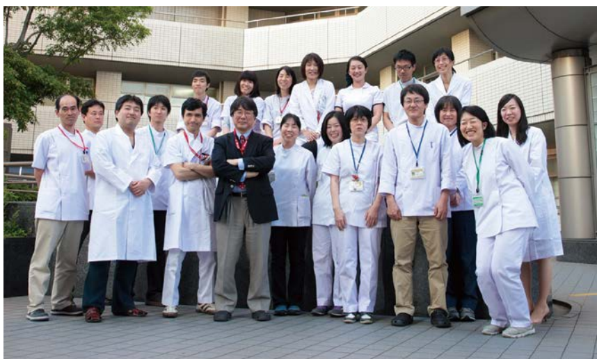
リハビリテーション科部のスタッフの集合写真