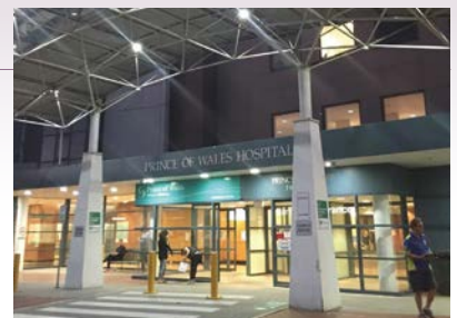
実習を行ったPrince of Wales Hospital