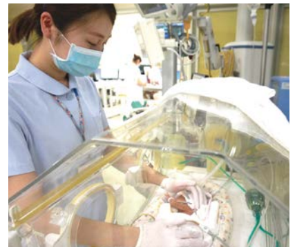
西部医療センターNICU