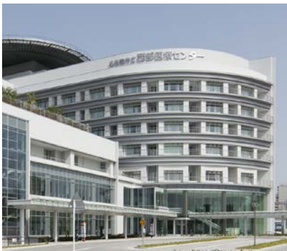
西部医療センター外観