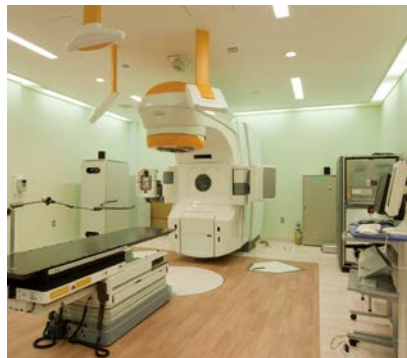
西部医療センターリニアック室