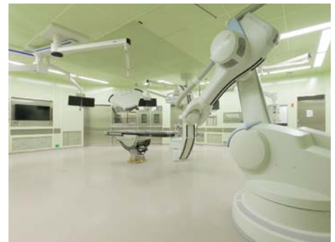
東部医療センターハイブリッド手術室