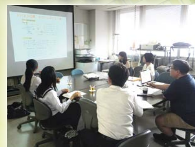
研究室体験実習の様子