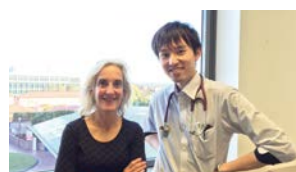
感染症内科の 優しくも厳しい恩師と