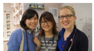
お世話になった循環器内科 レジストラと現地学生と