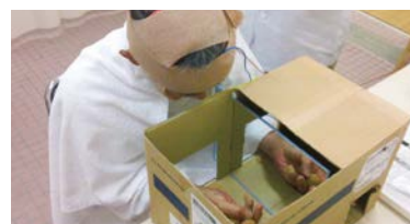
ニューロリハビリテーションの一環としての経頭蓋直流電気刺激療法