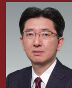
片岡 洋望 教授