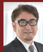
中内 茂樹 教授