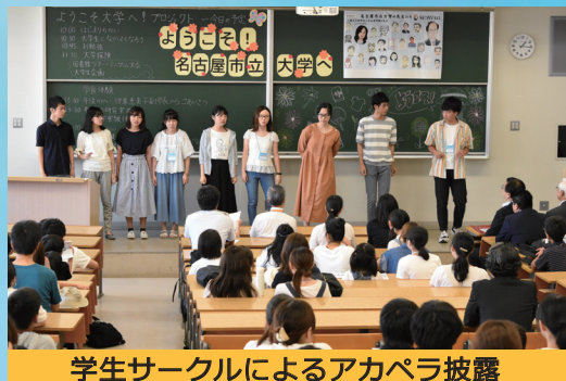
学生サークルによるアカペラ披露