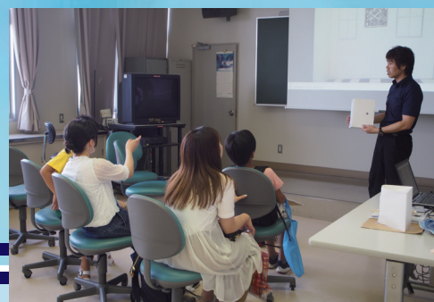
教授カフェ(研究室訪問)の様子