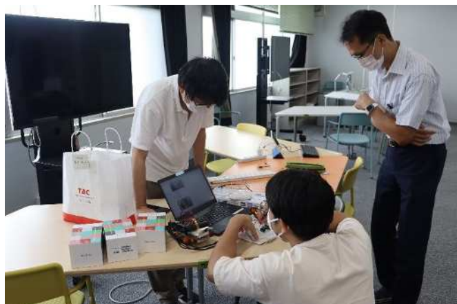
「総合生命理学部講座の様子」