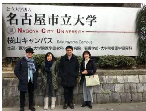
イギリスのブライトン大学との共同研究（英国でHIV検査キットを自動販売機で普及させる取り組みの成功事例の紹介を受けました）