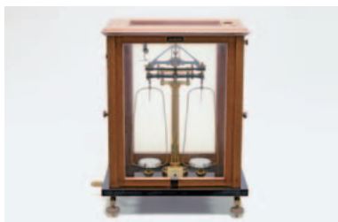
▲薬学部前身校時代から使用された天秤

大学に所蔵される学生生活に関する資料を展示するとともに、卒業生の皆様から寄贈された思い出の品々を展示しています。