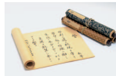
▲名古屋市立女子高等医学専門学校入学生「誓」

名古屋市立大学の前身校から今日に至る歴史について、新たに発見された公文書、キャンパス図面など大学のあゆみを語る資料を展示しています。