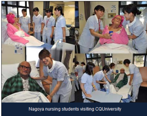
Nagoya nursing students visiting CQUniversity

A group of nursing students visiting from Japan's prestigious Nagoya University got more than they bargained for when they met two CQUniversity academics posing as elderly patients, in the Rockhampton Campus Nursing labs.