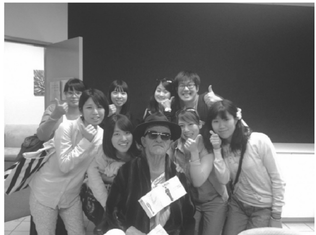
模擬患者に扮した看護教員と一緒に