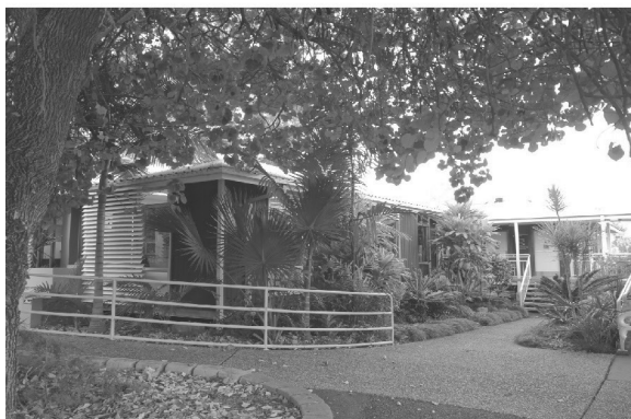
英語の授業を行った Language Centre