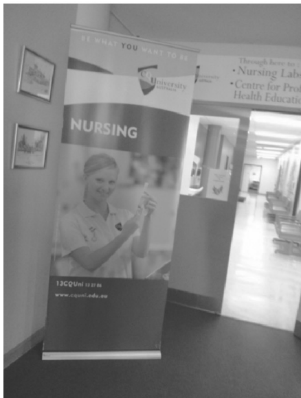
CQU 看護学部の入り口